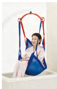
パオメッシュブルー フルタイプ