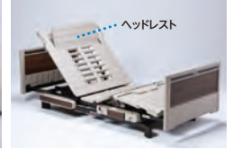
ヘッドレスト機能