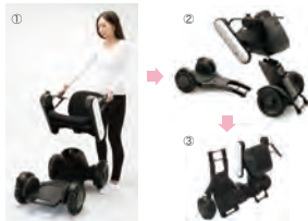
3ステップで簡単に分解して持ち運びが可能