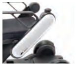
力を入れずに操作できるコントローラー