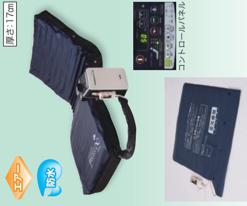
ブラス専用パッド

[ポンプ質量]4kg [材質]エアセル:ポリウレタンフォーム表面シボ加工 (抗菌)、ベースマット:ブレスエア (制動)、ヘッドアップセンサー:ABS樹脂、ベッドアープセンサー:アイロンオックス、下面:ポリエステルメッシュすべり止め布付き (抗菌)、カバー:ポリウレタンフィルム表面シボ加工 (抗菌)、中身:ポリエステル100%、コントローラー:ABS樹脂