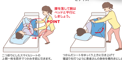
二つ折りにしたスマイルシートの上側一枚を両手でつかみ手前に引きます。つかんだシートをゆっくり上方に引き上げて寝返りを打つように患者さんの身体を横向きにします。

※課税...非課税のベッドと一体となって購入または貸与される場合は非課税となります。課税商品の「希望レンタル価格」及び「お客様負担」の金額は、全て税込みの金額となっております。