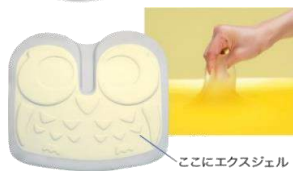
ここにエスジェル